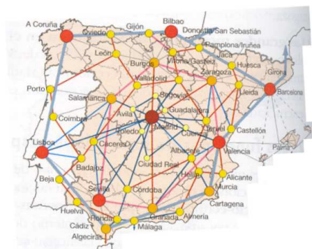
Teoría de Christaller aplicada a España